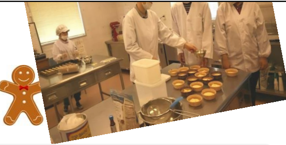
あさ作業所のクッキー班のみなさん おつかれさまでした！！